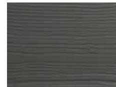
Minerai de fer