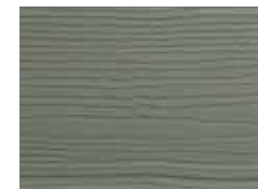
Poussière de lune