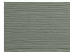
Fougère des prés