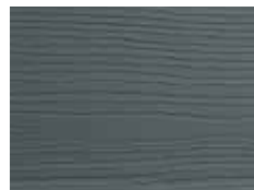
Vagues de minuit