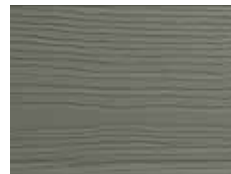
Vent de fumée