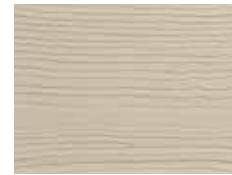
Sable de Monterey